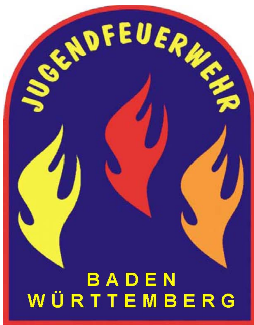
Jugendflamme Baden Württemberg

Hinter dem Begriff Jugendflamme verbirgt sich ein Programm, welches die Angehörigen der Jugendfeuerwehr während ihrer Dienstzeit begleiten soll, sie fordert und prüft, sie begeistert und anregt, aber auch auszeichnen soll.