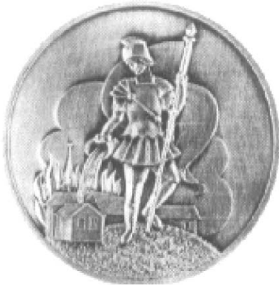
Florian-Plakette der Jugendfeuerwehr Baden Württemberg

Die Florianplakette der Jugendfeuerwehr Baden-Württemberg wird als Dank und Anerkennung für Verdienste um die Jugendfeuerwehr Baden-Württemberg an nicht in der Feuerwehr aktive tätige Personen verliehen. Im übrigen gelten die Richtlinien für die Ehrennadel der Jugendfeuerwehr Baden-Württemberg sinngemäß.