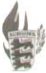
Ehrennadel der Jugendfeuerwehr Baden-Württemberg